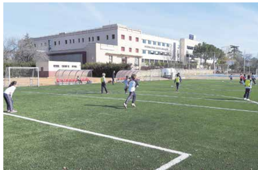
El centro cuenta con instalaciones deportivas al aire libre para la práctica de distintos deportes