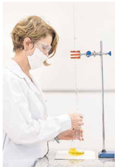
Laboratorio de Química

Con una metodología en la que la experimentación a través del juego es protagonista, este centro cuenta con un sistema curricular flexible y un profesorado motivado, altamente cualificado, nativo, tanto británico como español, según la materia a enseñar, y con experiencia demostrada. Y todo ello, adaptándose a las necesidades individuales de cada alumno. CBS,