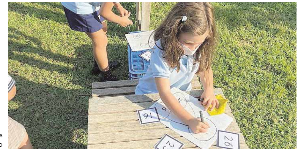
Clase de Matemáticas en las instalaciones exteriores del colegio

International School Andalucía forma parte de International School Partnership (ISP), un grupo educativo mundial formado por más de 48 colegios ubicados en 13 países. Pertenecer a este grupo garantiza unas excelentes oportunidades de aprendizaje internacionales que se organizan exclusivamente para los alumnos del grupo.