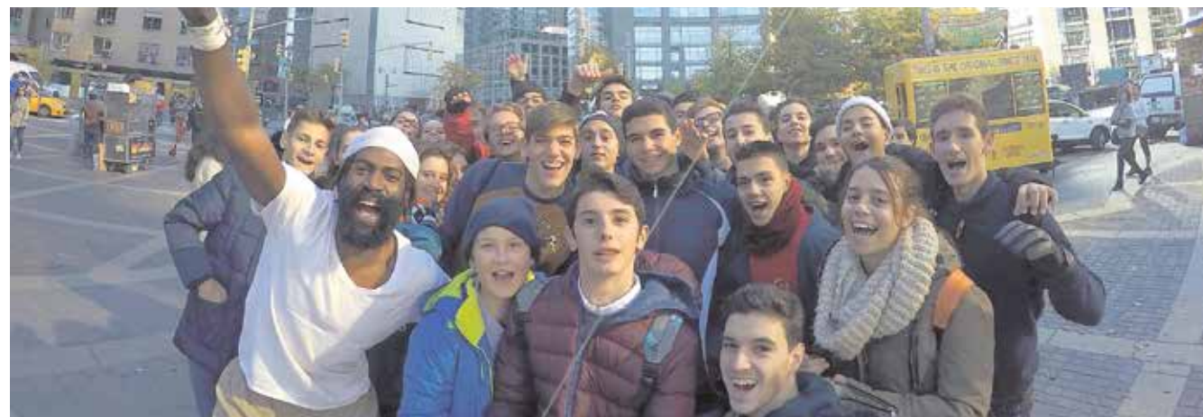
Viaje internacional que realizan los alumnos del centro todos los años