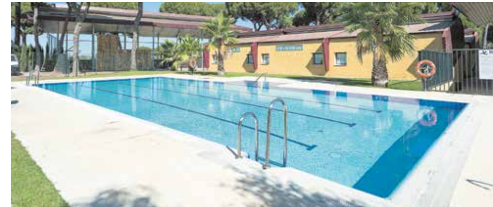
Piscina del CBS

naturaleza y las relaciones afectivas. Por ello, en este proyecto se fomentan aquellos valores humanos más importantes en el desarrollo de la persona: la tolerancia, el respeto, la responsabilidad, la solidaridad y la determinación. «Creemos que la educación que hoy demos a nuestros hijos será la que les ayude en el futuro a afrontar la vida con resolución y desenvoltura. «Y de ello dependerá su felicidad», explican desde el centro.