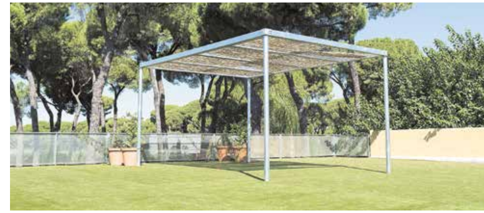
Zona de estudio y descanso exterior para Bachillerato

Para la consecución de todo ello, nace CBS Altogether - Entorno CBS que aglutina al CBS The British School of Seville - Colegio Británico de Sevilla, al Centro de Educación Infantil CBS Pre-School, a las Academias de idiomas CBS Language Academy y al Campamento de verano, CBS Summer Camp. CBS Altogether - Entorno CBS se concibió desde un principio como un proyecto de futuro, diferente a lo establecido hasta ahora en la línea educativa. El Entorno CBS considera como piezas básicas para la formación integral del niño el desarrollo de la personalidad, la madurez emocional, la buena salud, el contacto con la